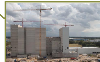
Castellmühle Krefeld (Weichweizen, Roggen) → Hier entsteht die modernste Mühle Europas mit 360.000to p.a.