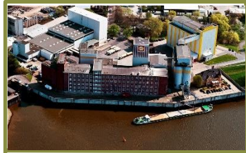
Aurora Mühle Hamburg (Weichweizen, Roggen, Dinkel) → Erweiterungsmaßnahme in Umsetzung