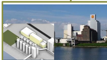
Hildebrandmühle Mannheim (Durum) → Hier entsteht auch eine neue Fabrik zur Herstellung von CousCous & Bulgur