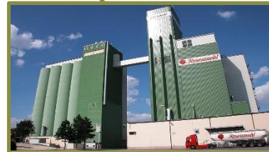
Rosenmühle Ergolding (Weichweizen, Roggen, Dinkel)