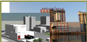
Müller's Mühle Gelsenkirchen (Hülsenfrüchte) → Hier entsteht eine Spezialfabrik zur Proteinanreicherung