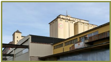
Hildebrandmühle Frankfurt (Weichweizen, Roggen, Spezialprodukte)